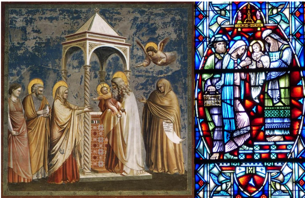
Handout 4: Fresko von Giotto di Bondone (14. Jahrhundert, Public Domain, Quelle: Wikimedia ) und Buntglasfenster aus der St. John's Church in Omaha, Nebraska (19. Jahrhundert, Fotograf: Workman, Creative Commons CC BY-SA 4.0, Quelle: Wikimedia ).

also etwa 400 Jahre vor unserem Gemälde. Rechts daneben finden wir das Foto von einem Kirchenfenster der in den 1880ern erbauten Johanniskirche in Omaha in Amerika. Auch hier die gleiche Szene, auch hier die beiden Tauben.