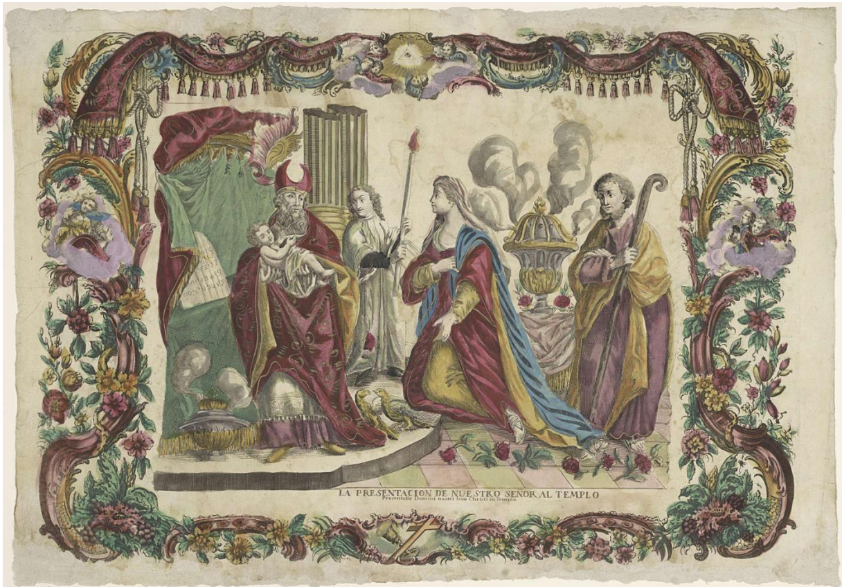
Handout 3: Italienische Druckgrafik aus dem 18. Jahrhundert (Public Domain/PDM 1.0, Quelle: Europeana/Rijksmuseum ).

stellungen dieses Bibeltextes zu finden ist. Wenn wir auf einem Gemälde so einen Korb oder Käfig mit zwei Tauben sehen, der in einem Tempel übergeben wird, ist das schon ein guter Hinweis darauf, dass hier Lukas 2 dargestellt ist. Ganz rechts sei nochmal die besondere Kopfbedeckung des Hohepriesters hervorgehoben, eine sogenannte Hörnermitra. Auch diese ist ganz typisch für Darstellungen genau dieser biblischen Szene.