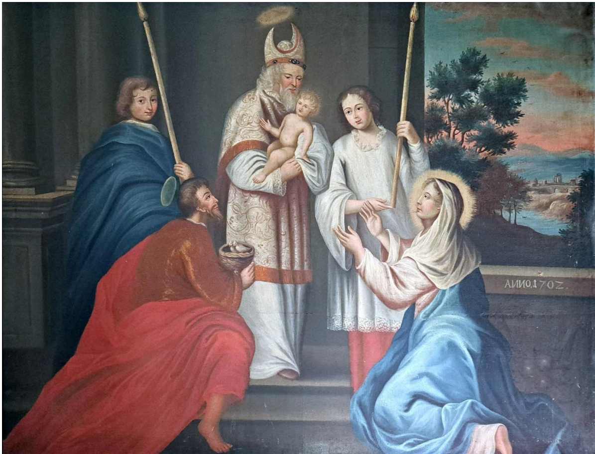
Handout 1: Darbringung im Tempel, unbekannter Künstler, 1702, Christuskirche Wernigerode.