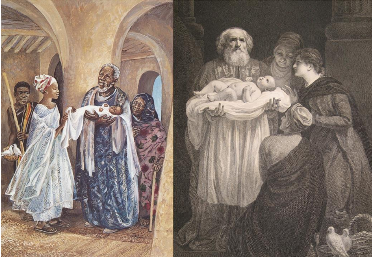
Handout 5: Aquarell aus dem Bilderzyklus „Vie de Jesus Mafa“ (1970, Kamerun, Quelle: Vanderbilt University Divinity Library . Original Copyright Information: JESUS MAFA. Presentation of Jesus in the temple, from Art in the Christian Tradition, a project of the Vanderbilt Divinity Library, Nashville, Tennessee, https://diqlib.library.vanderbilt.edu/act-imagelink.pl?RC=48303 , original source: http://www.librairie-emmanuel.fr , original contact page: https://www.librairie-emmanuel.fr/contact .) und Kupferstich von William Bromley aus der Macklin-Bibel (1800, Copyleft/FAL, Quelle: Wikimedia ).

Vielleicht lädt uns all das ja dazu ein, beim nächsten Besuch in der Kirche ein paar Minuten vor dem Gemälde zu verweilen und daran zu denken, mit wie vielen anderen Werken über die gesamte Kirchengeschichte hinweg es uns verbindet und was wir ganz persönlich aus der dargestellten Szene mitnehmen können.